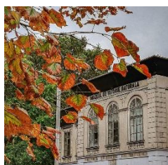
Muzeul de Istorie Naturală