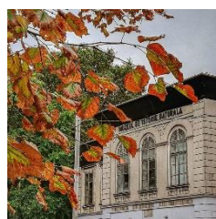
Muzeul de Istorie Naturală